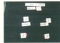
图三: 常温条件下, FDCY-2型防弹防刺服(3号样品)正面弹痕形状