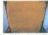
图十: 低温条件下, 背衬材料上弹痕形状