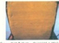
图八: 高温条件下, 背衬材料上弹痕形状