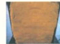
图四: 常温条件下, 背衬材料上弹痕形状