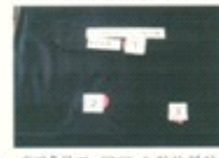
图七: 高温条件下, FDCY-2型防弹防刺服(4号样品)正面弹痕形状