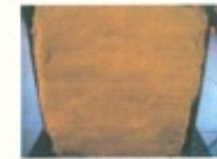
图六: 浸水条件下, 背衬材料上弹痕形状