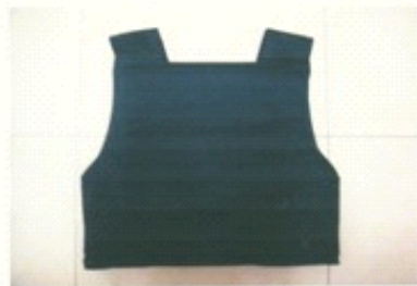
图二: FDCY-2型防弹防刺服背面外观