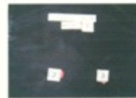
图五: 浸水条件下, FDCY-2型防弹防刺服(3号样品)正面弹痕形状