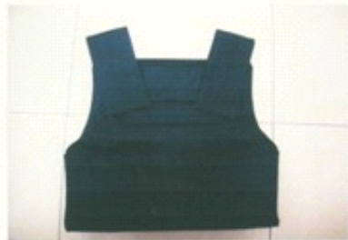
图一: FDCY-2型防弹防刺服正面外观